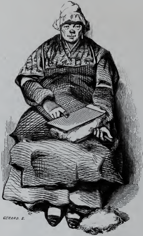
La Gardeuse de Matelas.